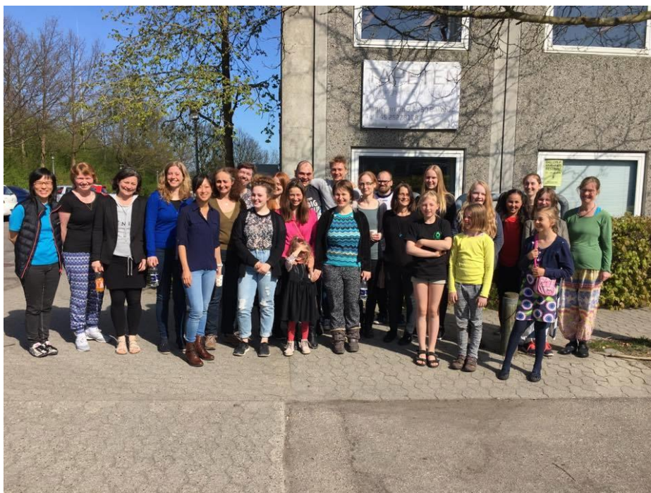
Familiefoto med alle deltagerne fra arrangementet

Initiativet til rekruttering og fastholdelse af flere pigespillere afholdt et succesfuldt arrangement i Tapeten i Ballerup d. 5. – 6. maj. Det var et åbent arrangement (dvs. ikke kun for piger), der blev afholdt sideløbende med en træningssamling for de bedste kvinder. I alt var der 27 piger/kvinder mellem 5 og 70 år til arrangementet, som dermed var en stor succes.